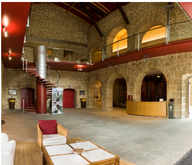
Sala de espera