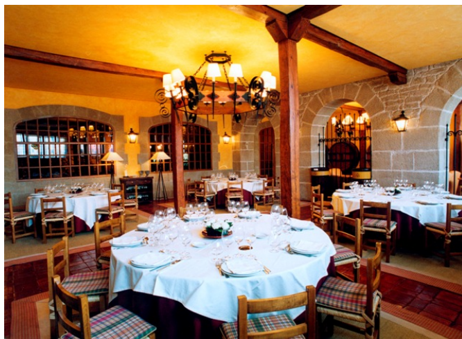
Sala de degustación y comedor