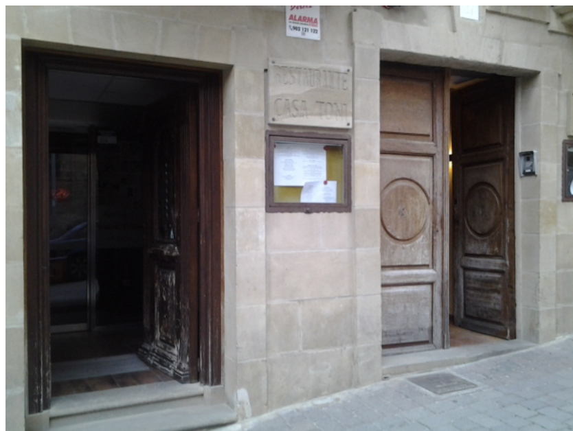
Acceso al establecimiento