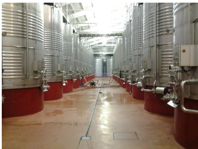
Zona de elaboración