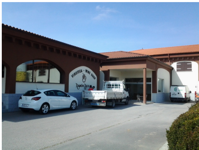
Acceso al establecimiento