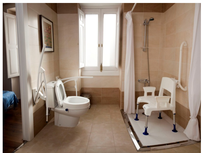
Aseo de la habitación