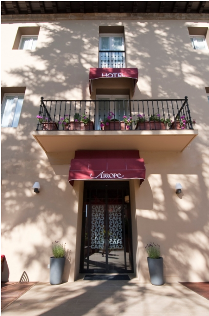
Acceso al establecimiento