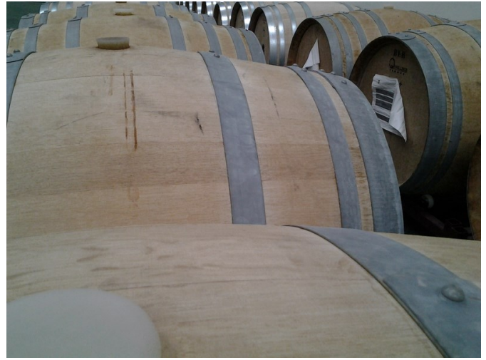
Sala de barricas