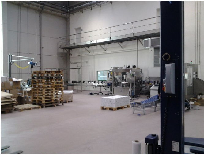
Zona de elaboración