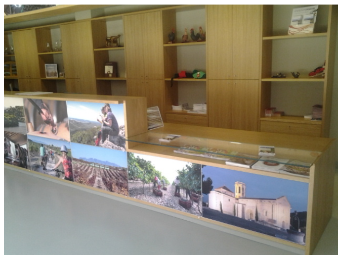
Mostrador de recepció