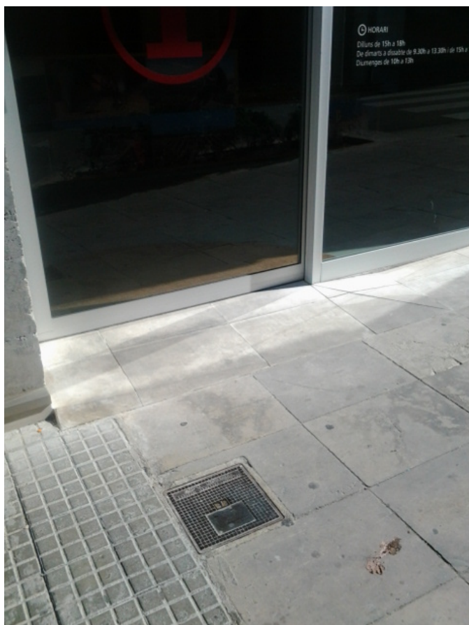
Escalón rebajado de la puerta de acceso