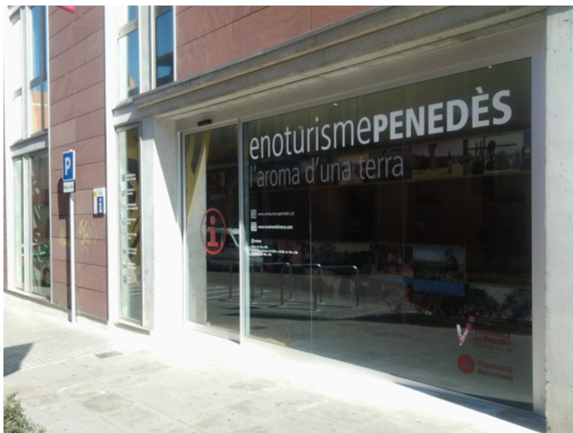
Acceso al establecimiento