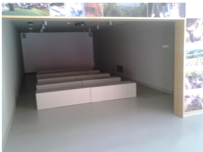
Sala de audiovisuales