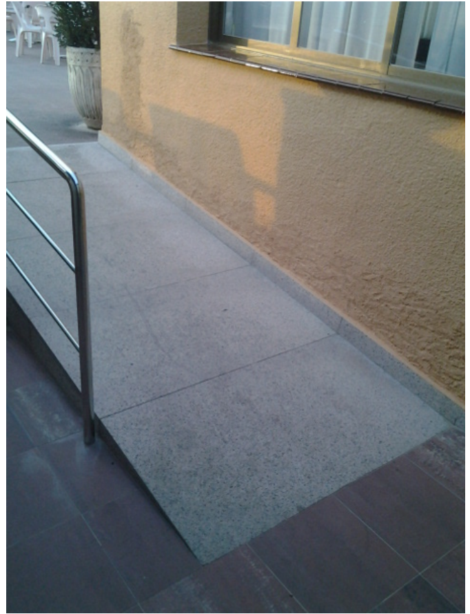
Rampa exterior para acceder al ascensor