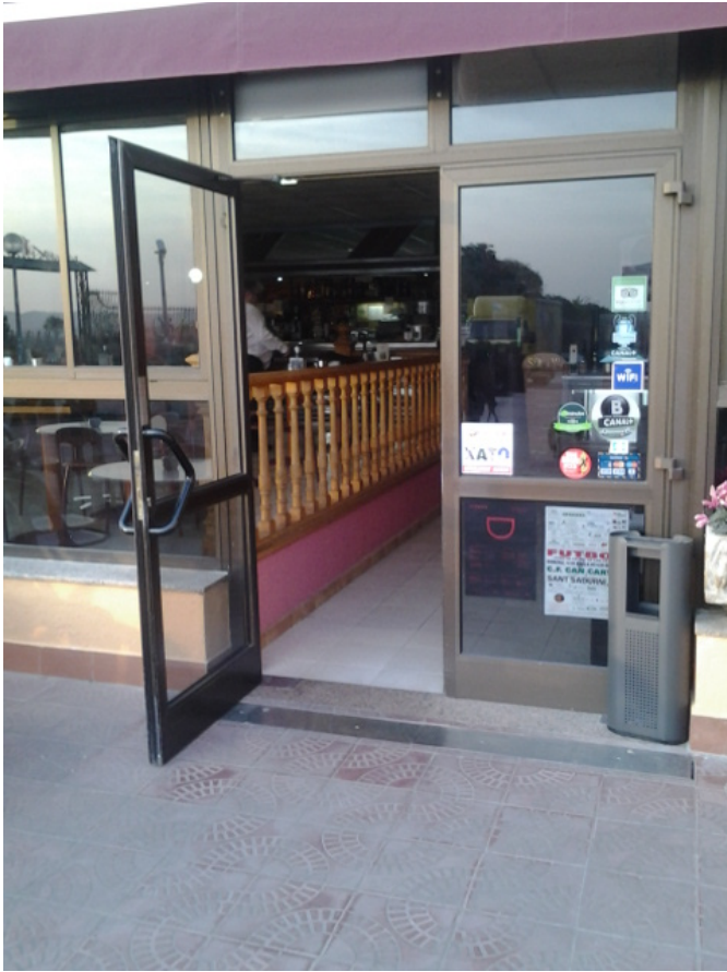
Acceso al bar y salones planta baja