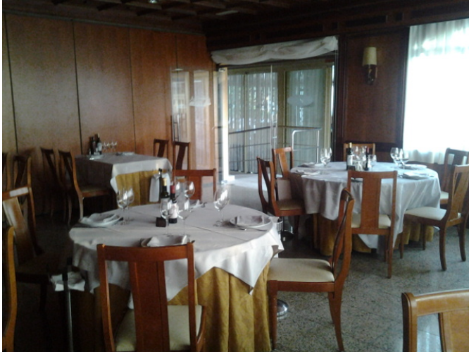
Salón comedor principal