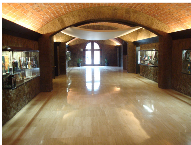
Zona de exposición