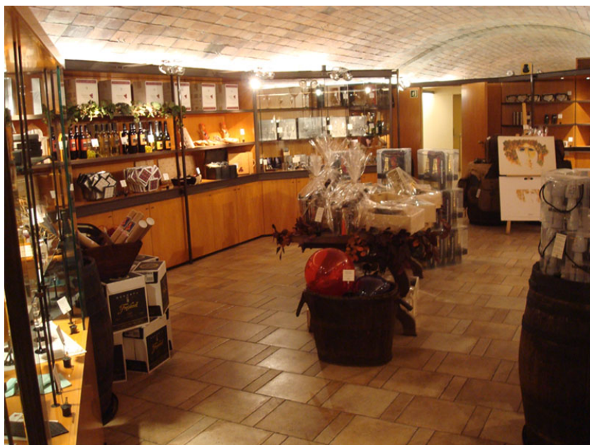
Sala de Catas y recepción