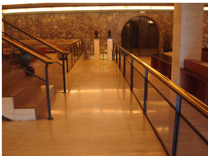
Interior de las Cavas