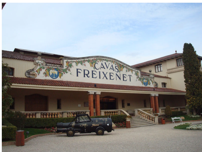
Vista de la puerta principal