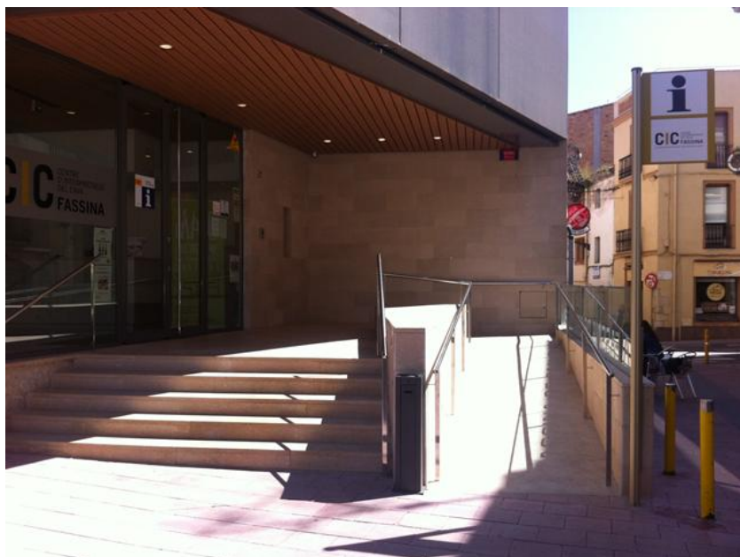
Acceso al establecimiento

Dirección: C. de L Hospital, 23. Oficina de turismo