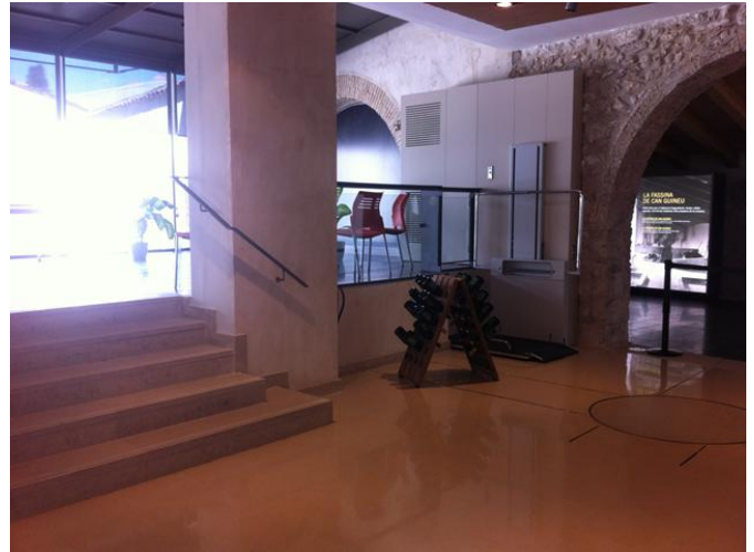
Acceso a la sala de catas