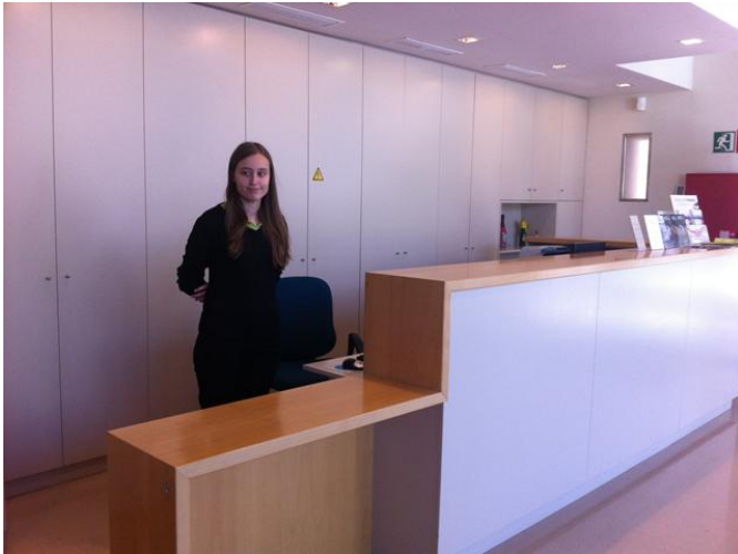
Mostrador de recepción