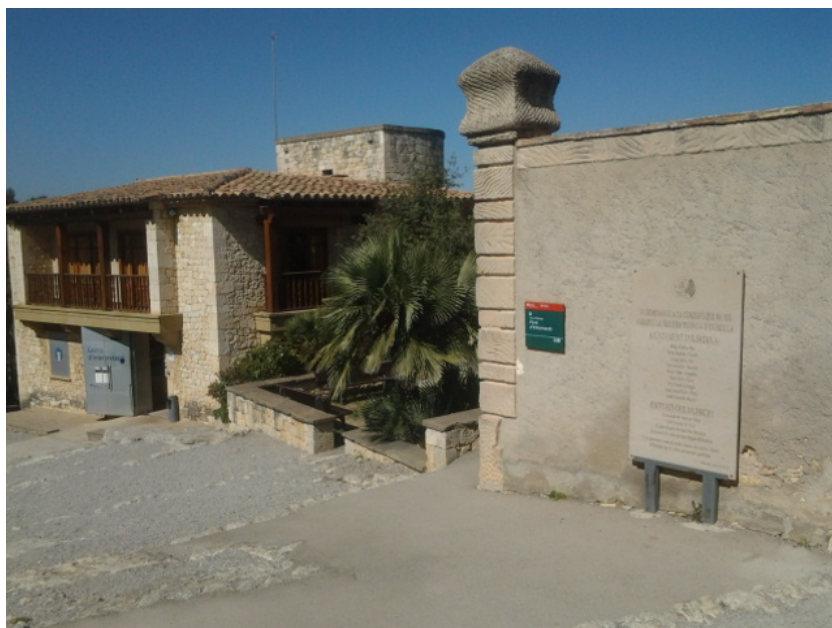
Acceso al establecimiento