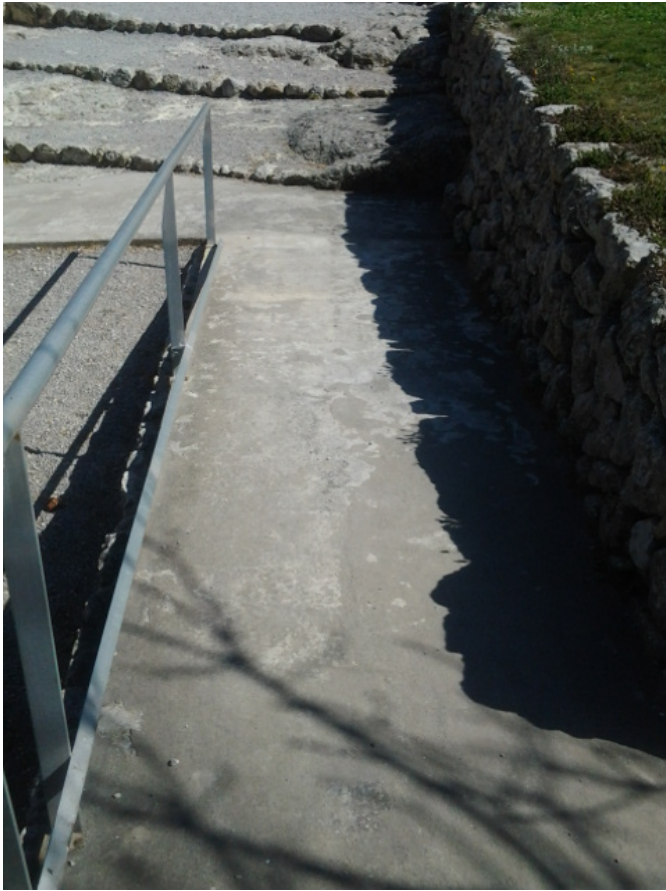
Rampa de acceso al edificio principal