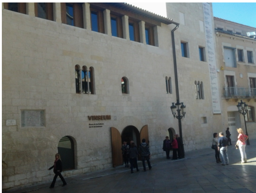
Acceso al establecimiento