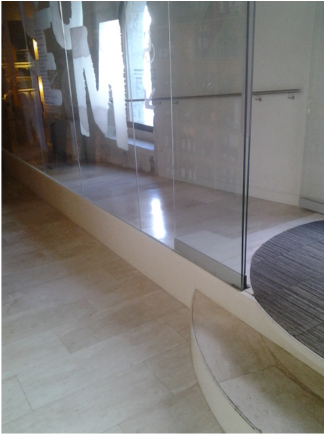
Rampa de acceso al interior del establecimiento