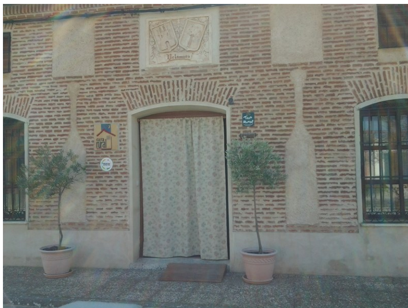
Acceso al establecimiento