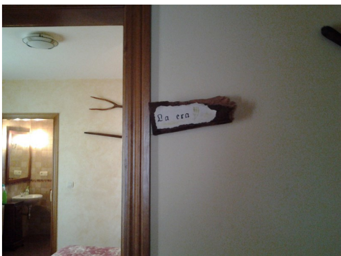
Señalización habitación adaptada