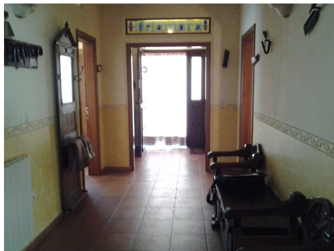
Vestíbulo de entrada