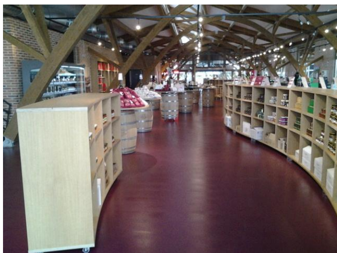
Circulación en el interior de la tienda y estanterías