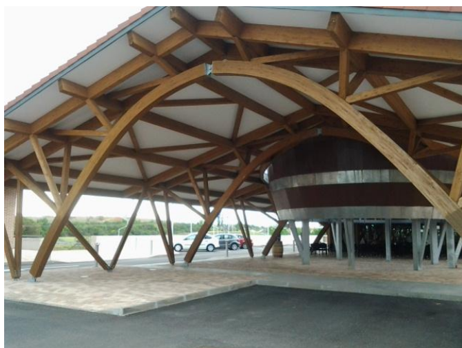
Porche de entrada al establecimiento