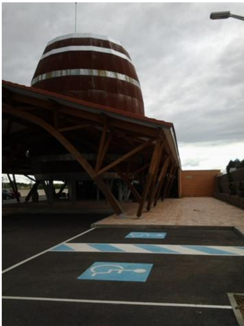
Fachada del edificio y plazas de aparcamiento para PMR