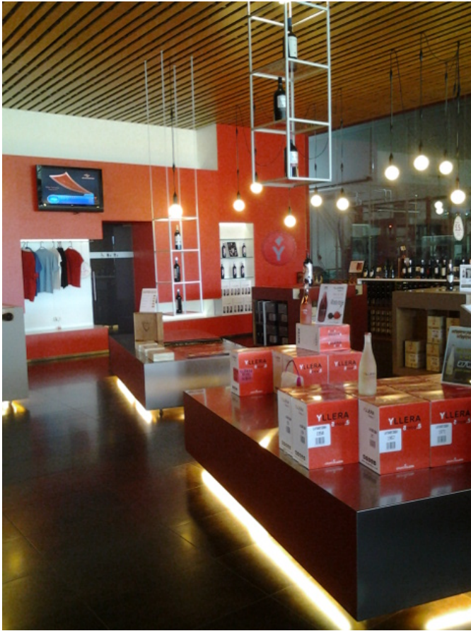
Zona de tienda