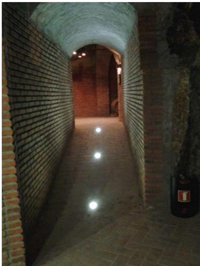
Circulación edificio "El hilo de Ariadna"