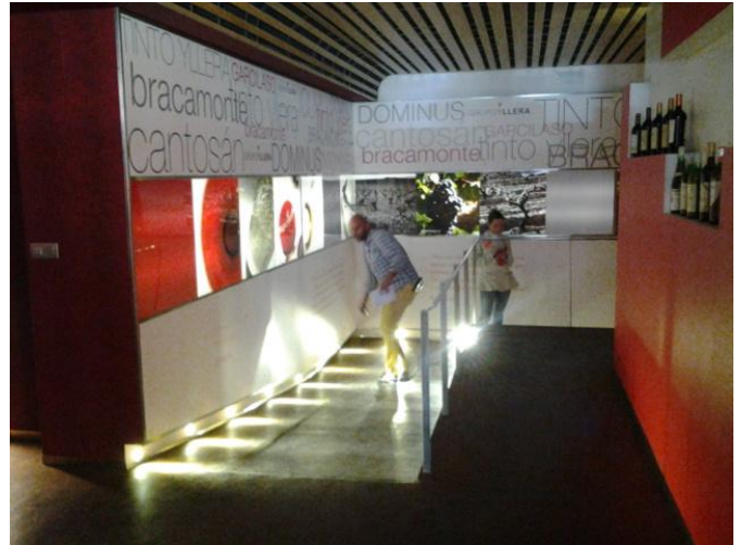
Recorrido por el edificio "Elaboración"