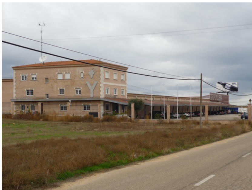
Edificio de recepción de la bodega de "Elaboración"