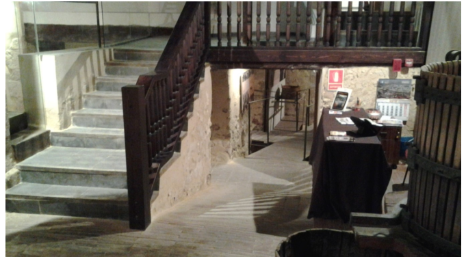
Zona de recepción