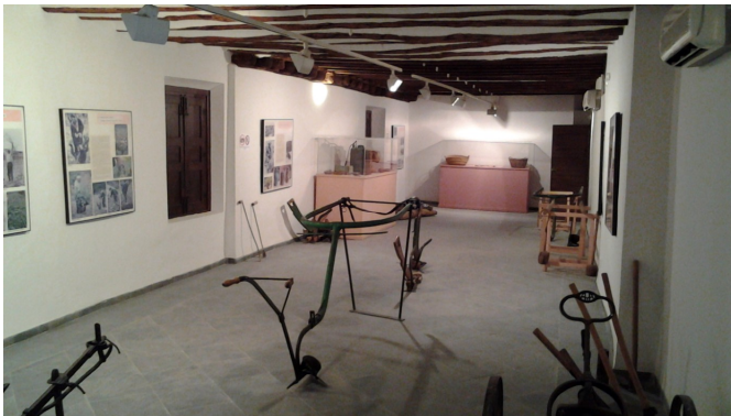
"Sala de la viña" - planta 2