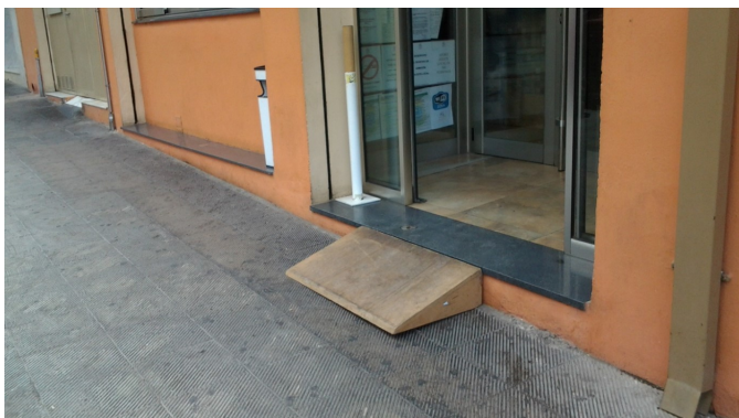
Acceso al establecimiento - detalle rampa móvil