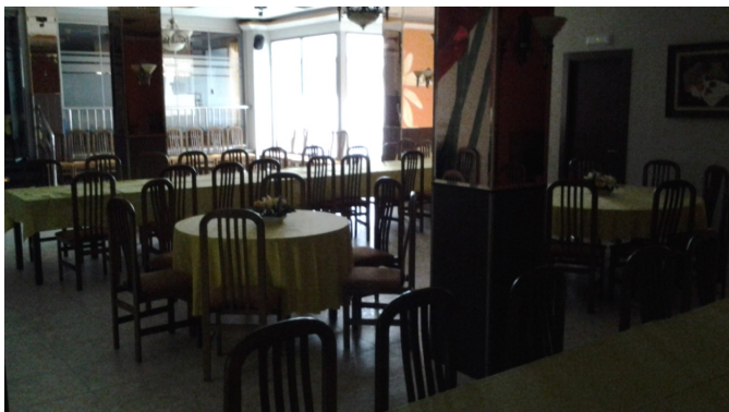
Salón comedor - planta baja