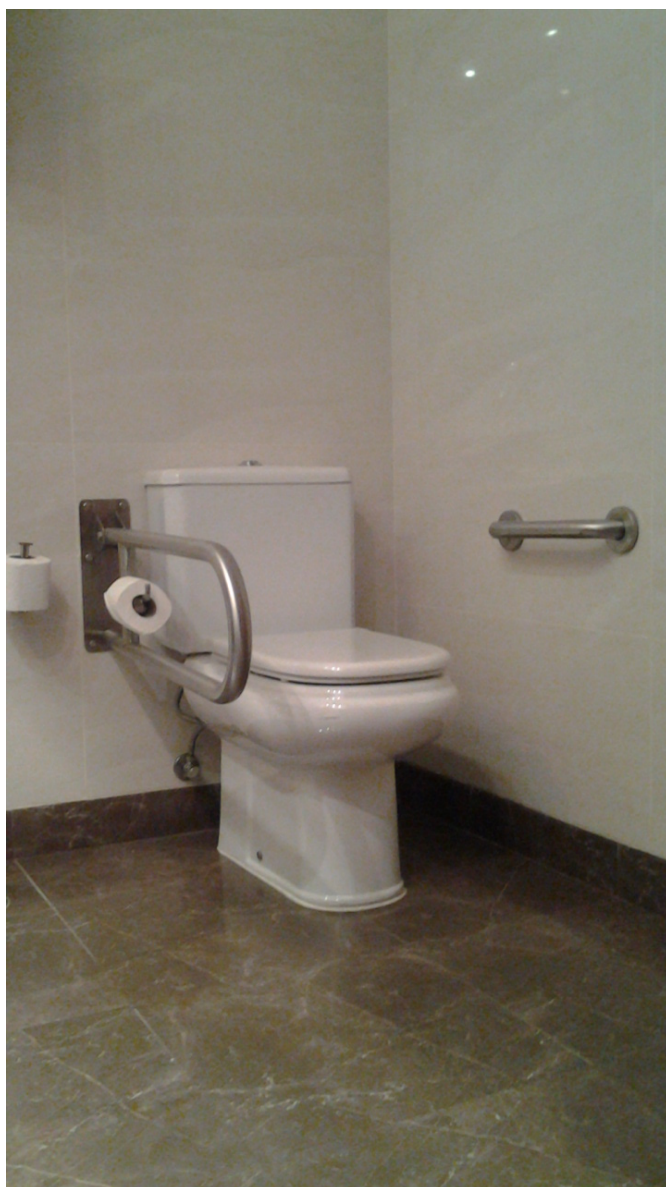
Aseo de la habitación adaptada