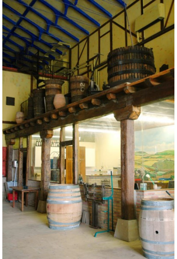
Espacio de introducción de la visita