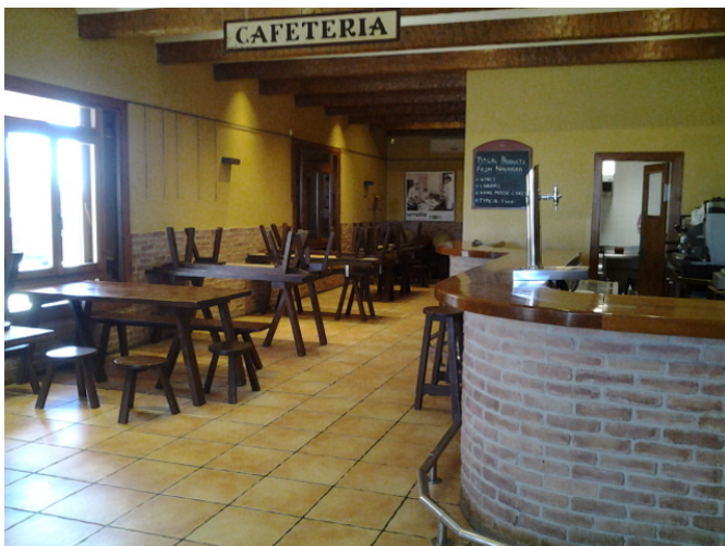
Zona de degustación