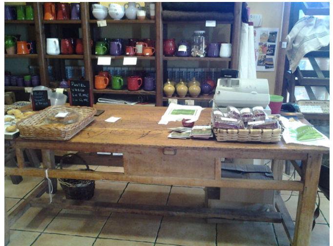
Mostrador de atención al público