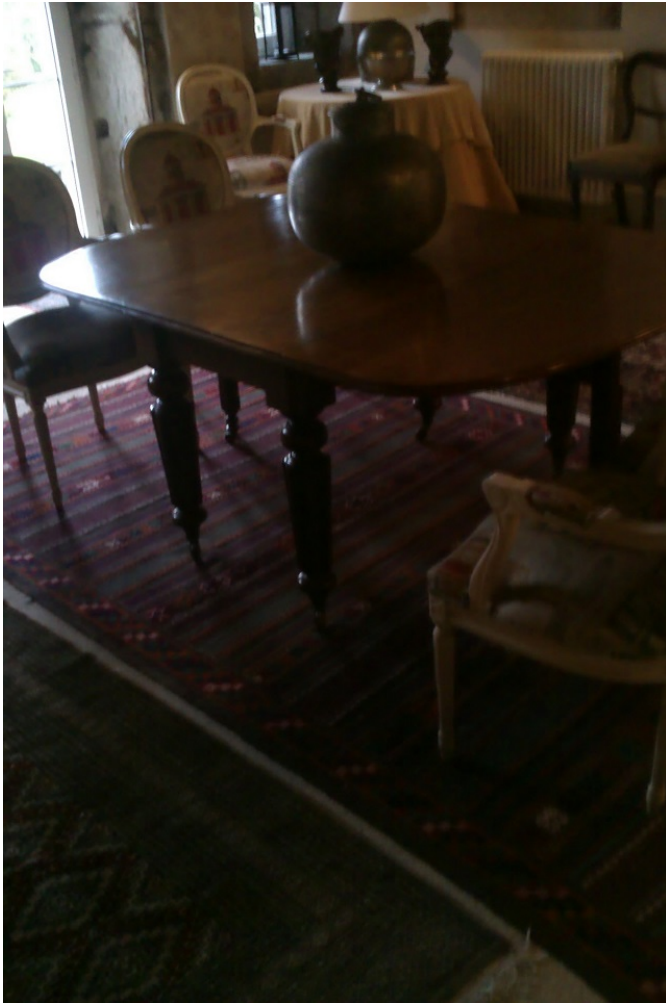
Sala de catas