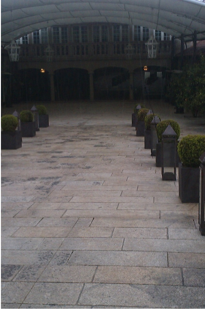
Patio exterior del pazo