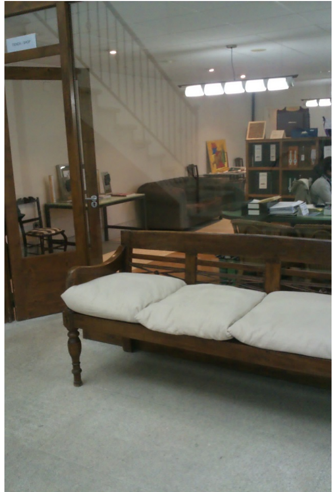
Zona de atención al público