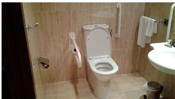
Aseo habitación adaptada - Inodoro