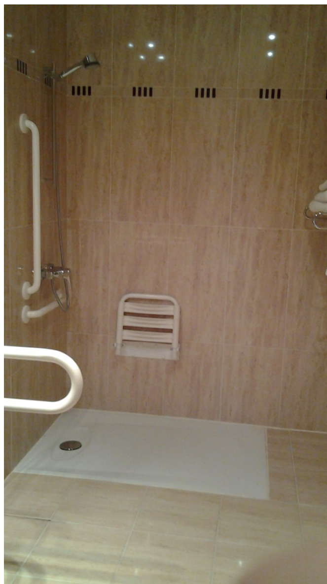
Aseo habitación adaptada - Ducha