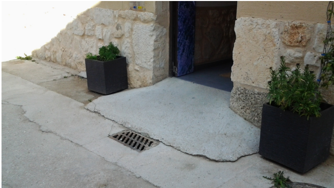
Acceso al establecimiento