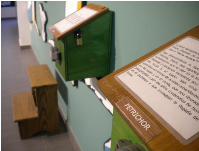
Sala de exposiciones - Detalle Braille