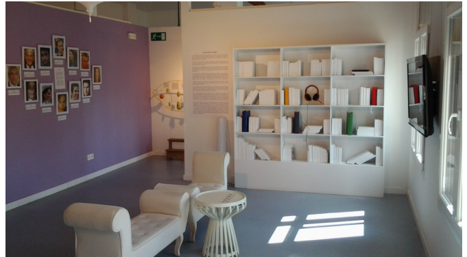
Sala de exposiciones