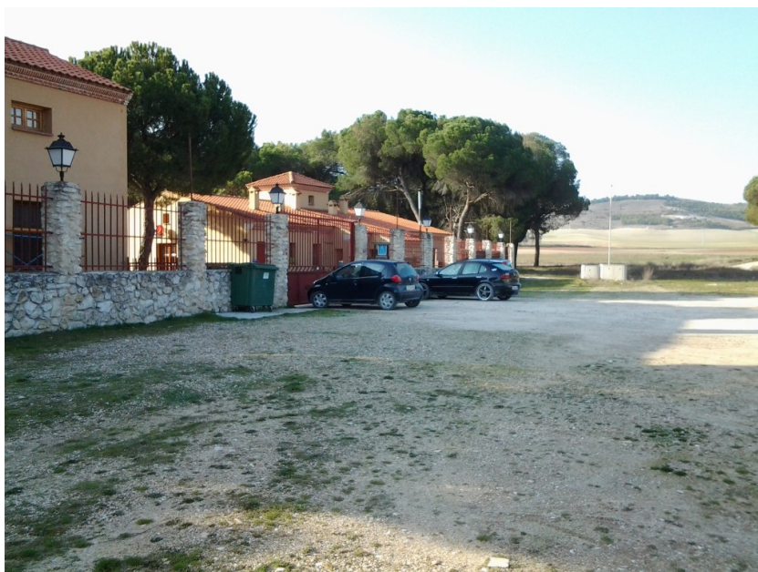
Fachada - Zona de estacionamiento exterior