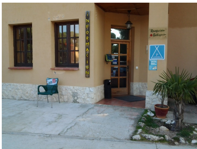
Entrada principal - Recepción