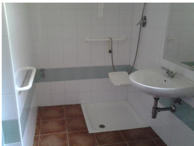
Aseo común adaptado - Ducha