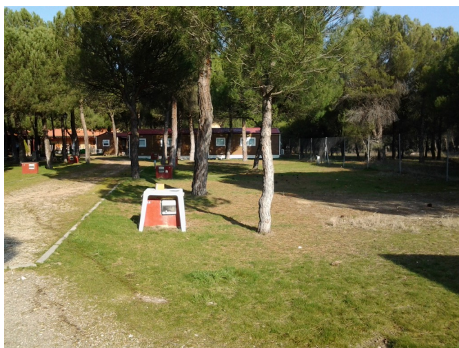
Zona de acampada