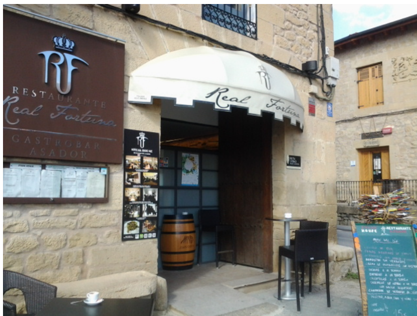
Acceso al establecimiento