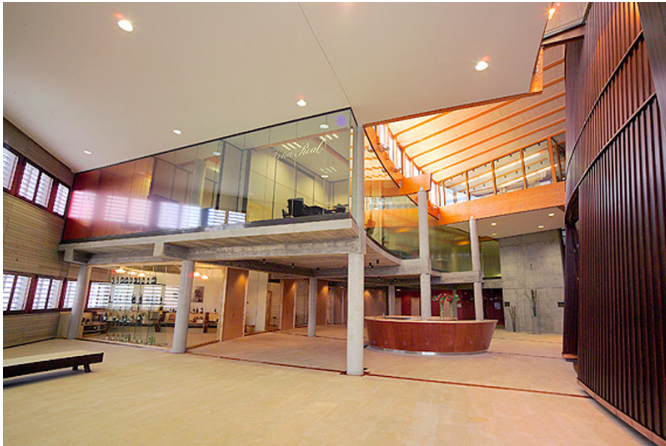
Interior de las bodegas con mostrador de atención