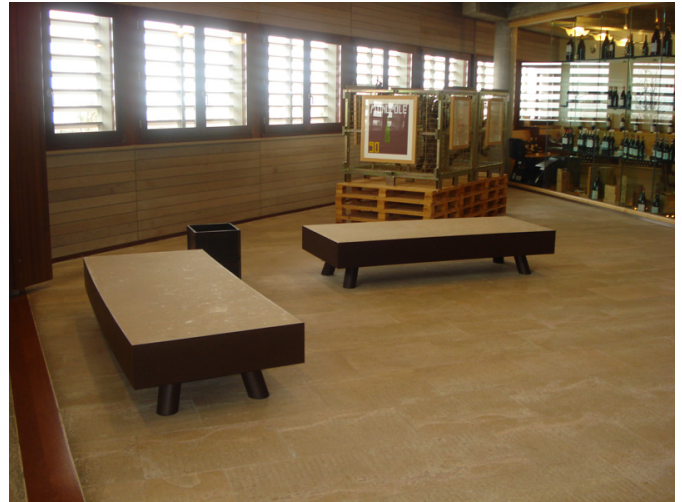
Sala de venta de vinos