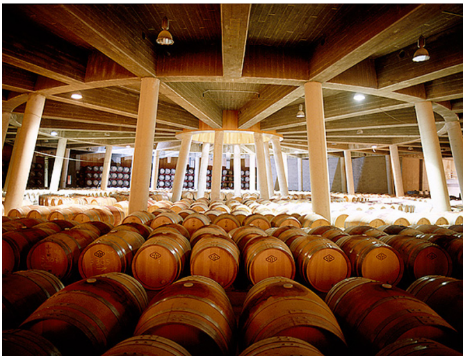
Barricas alineadas en la bodega