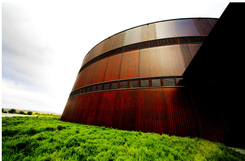
Edificio de las bodegas con forma de barrica de vino