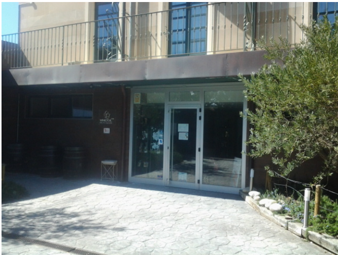
Acceso al establecimiento