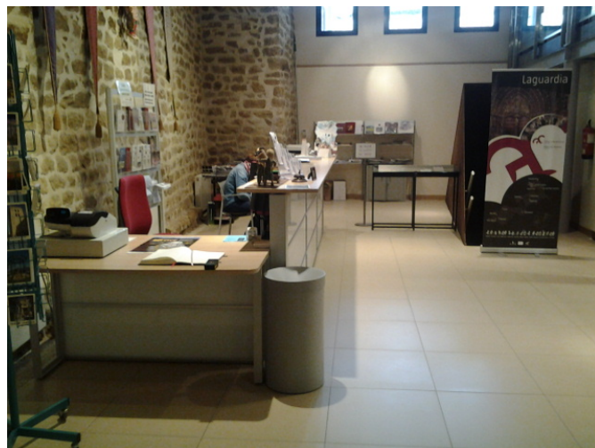
Mostrador de atención al público