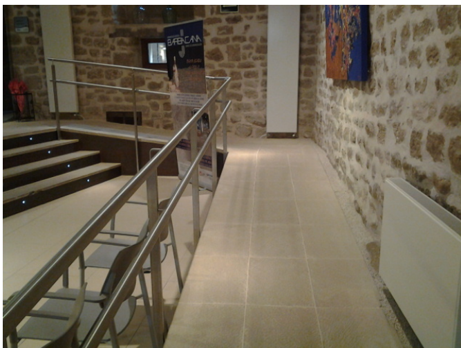
Rampa acceso zona de atención al público