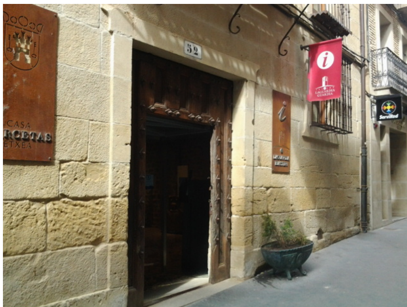
Acceso al establecimiento